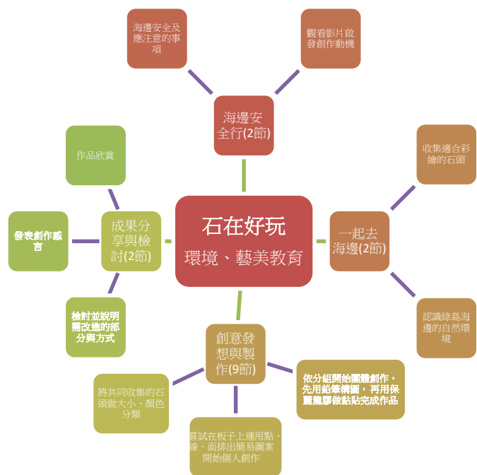
跨領域統整概念圖：