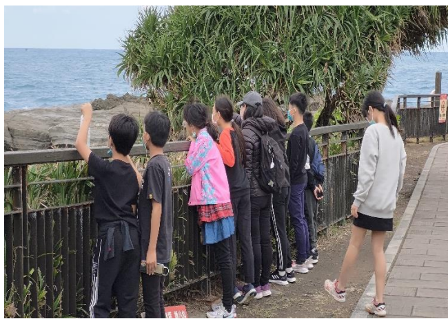
觀看石梯坪的海蝕平台