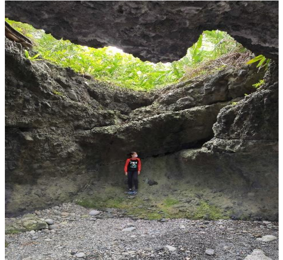
走訪石門遊憩區觀看有名的 march 海蝕洞、愛心海蝕洞和礁岩