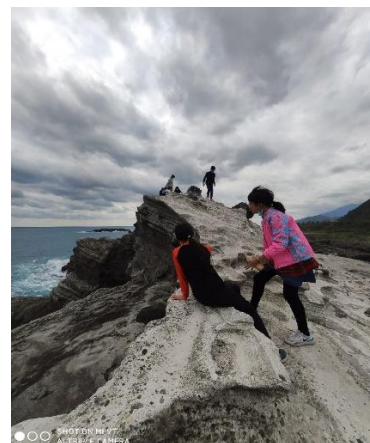
走上單面上近距離觀看平行層理的白色擬灰岩