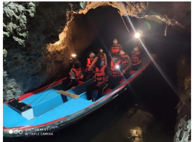
探訪月洞，聆聽月洞傳說並觀看鐘乳石、石筍、燕窩化石、蝙蝠