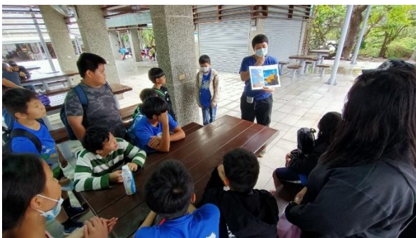
文字說明：大樹老師利用圖片方式說明海岸特殊地形及小野柳名稱的由來

選取具代表性之成果照片至少 6 張以上，並輔以文字說明。表格不敷使用時，可自行增刪。