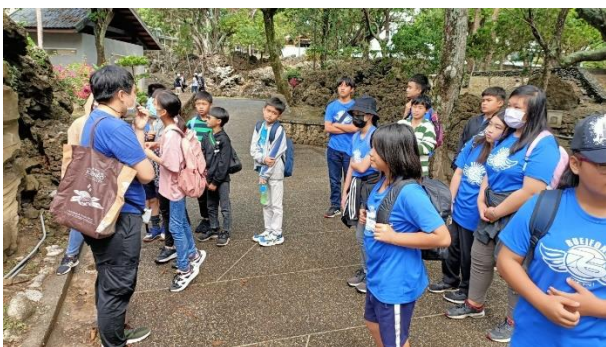
文字說明：學生觀察小野柳地形，了解地殼板塊運動的變化。