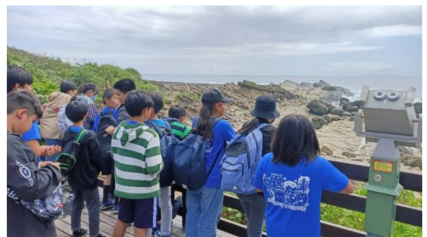
文字說明：學生至海邊體驗大自然海風的吹拂，並觀察海邊岩石的特殊造型。