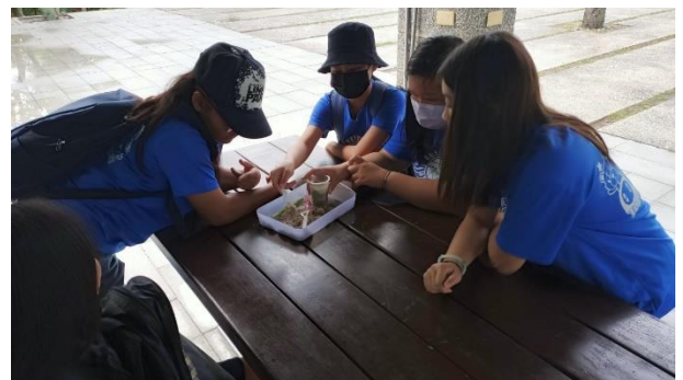
文字說明：學生利用動力沙遊戲來體驗大自然對於海岸岩石的風化、拍打等侵蝕作用。