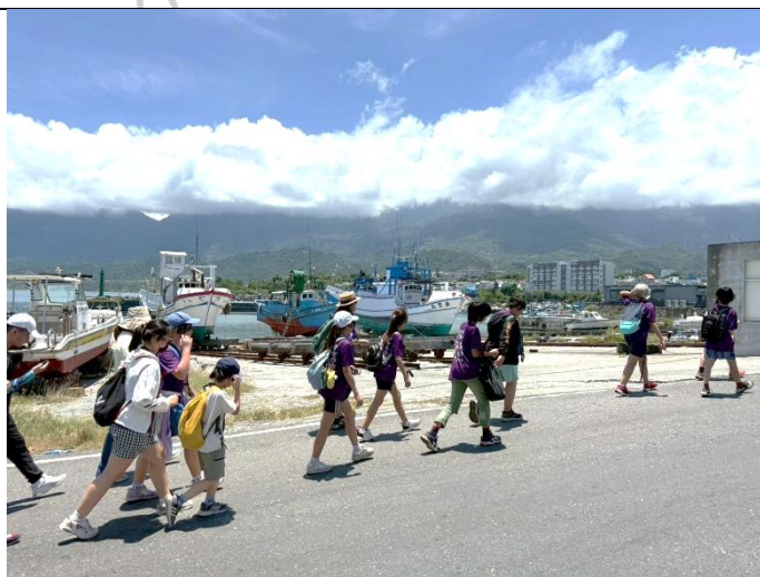
說明：來去成功漁港逛逛~~