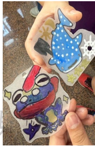
說明：可愛吧!我們的熱縮片創作