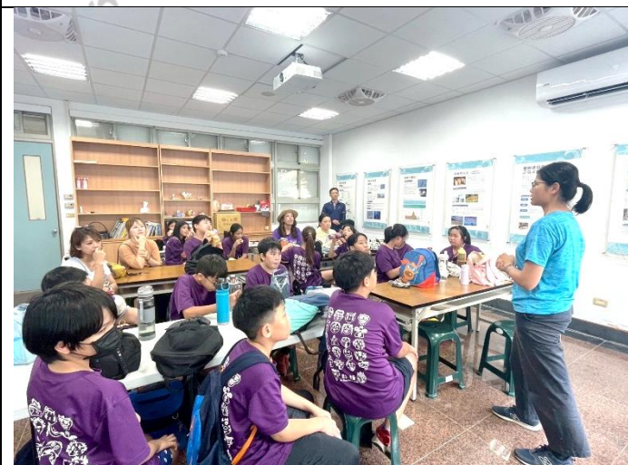
說明：活動後回饋與討論-SDGs 與我們的責任：海洋保育如何與永續發展連結，我們可以做哪些事情？