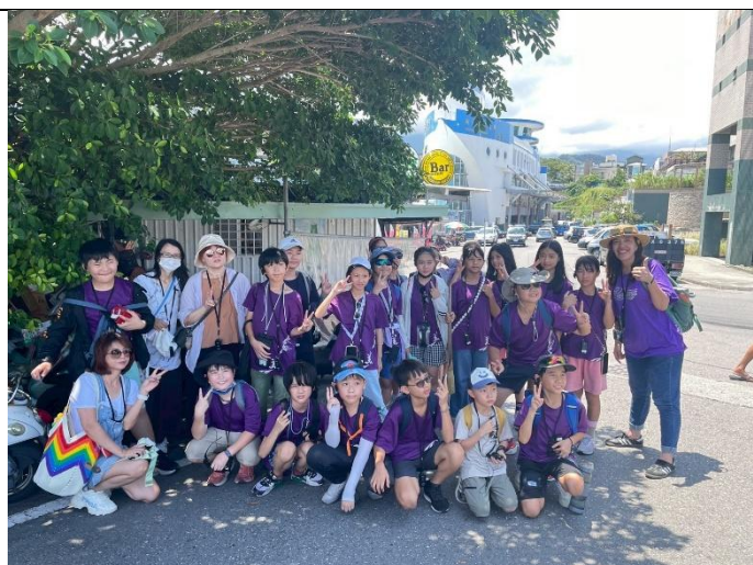
說明：與成功魚市場船型建築合影留念