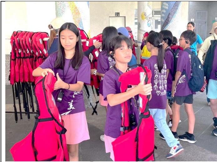
說明：穿上救生衣，準備搭船出海囉！