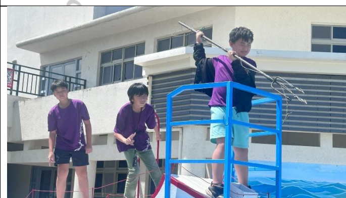
說明：看我鏢旗魚的英姿