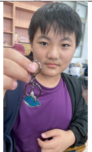
說明：可愛的海洋風熱縮片鑰匙圈完成囉!