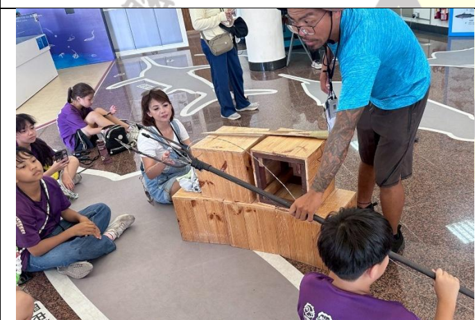
說明：認識古老捕魚技法-「鏢旗魚」，學生摸摸三叉鏢槍