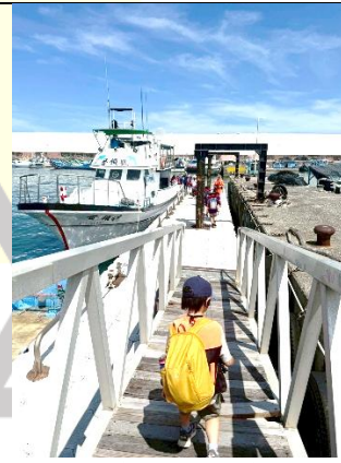
說明：準備登船囉！吹吹海風~~好舒服呀！