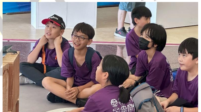
說明：認真上課的學生們