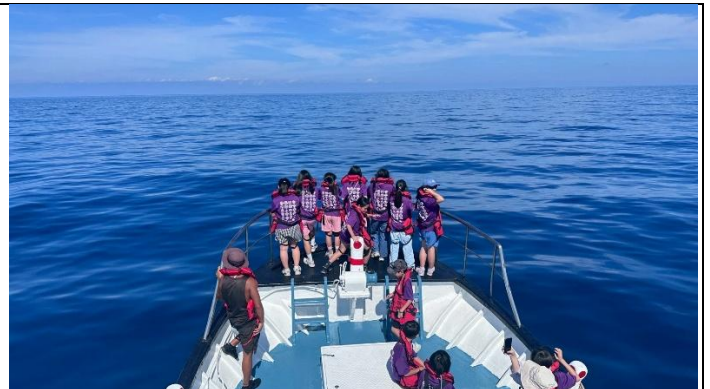
說明：認真尋找鯨豚蹤影，聆聽船長介紹海洋生態與鯨豚習性