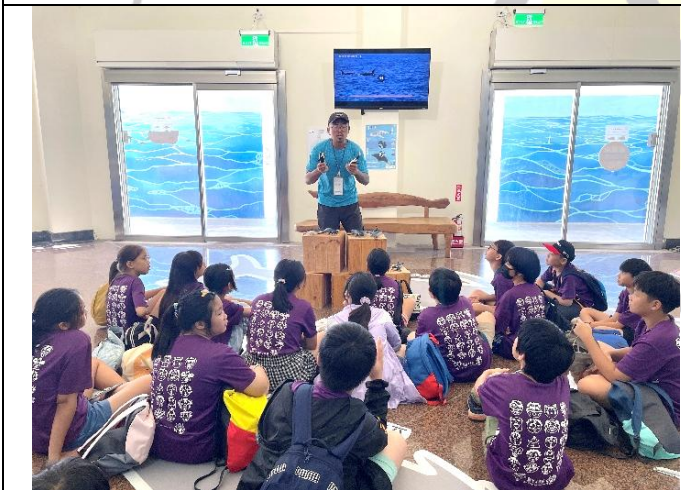
說明：認識海洋哺乳類-臺灣常見鯨豚種類介紹：花紋海豚、飛旋海豚等