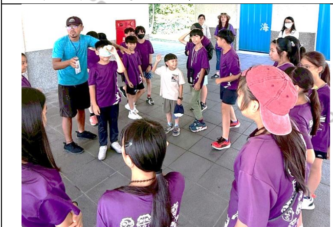
說明：鯨豚的語言世界-模擬鯨豚如何發出聲音、溝通與辨位的遊戲