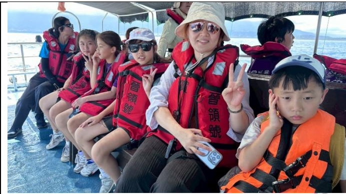
說明：第一次搭乘賞鯨船的經驗