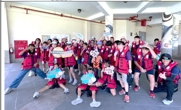
說明：出海前開心合影