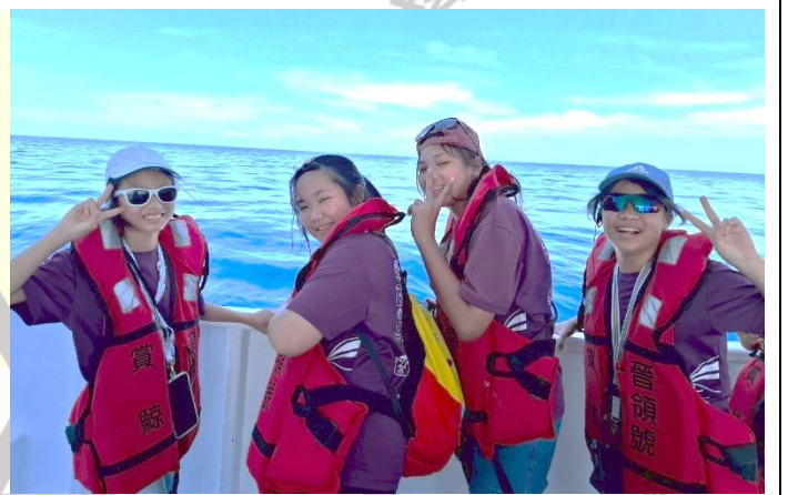
說明：耐心尋找鯨豚的學生們