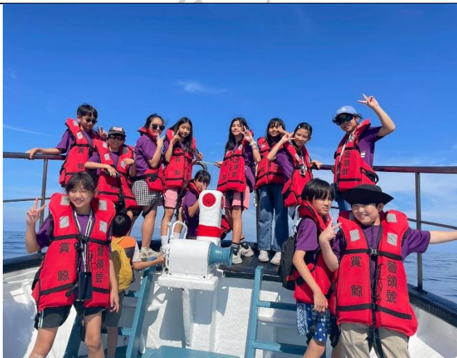
說明：陽光大海藍天+開心的學生們！