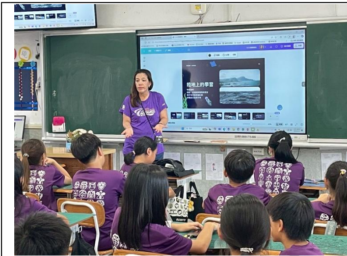
說明：教師進行行前活動說明