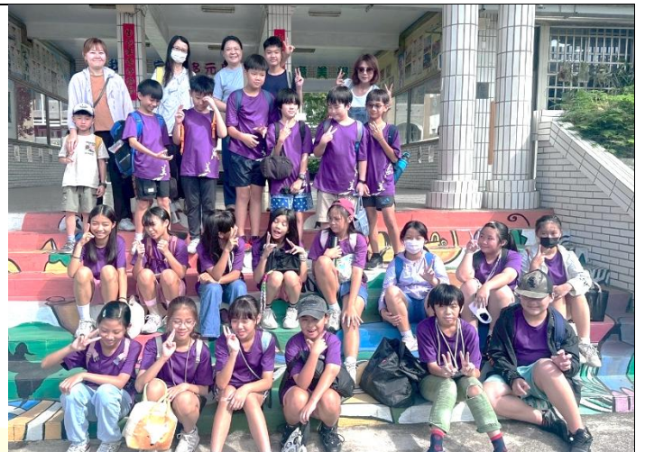
說明：參與的學生師長們，準備出發囉！