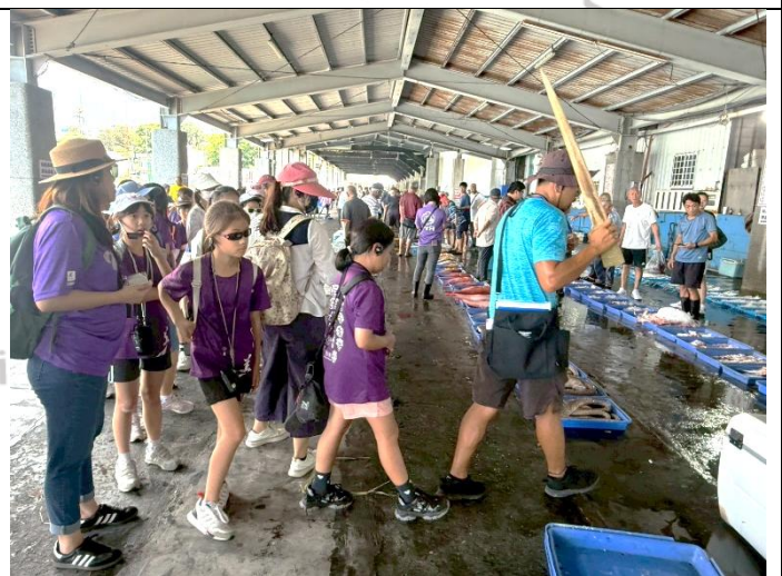
說明：成功魚市導覽