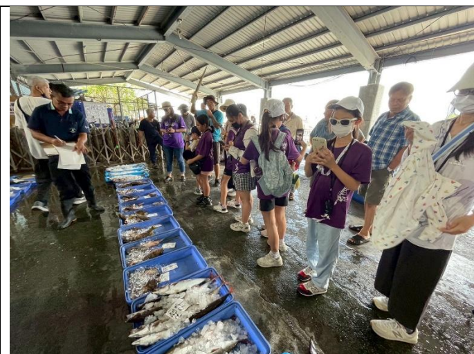
說明：哇~各式各樣的魚類~~太驚訝了!