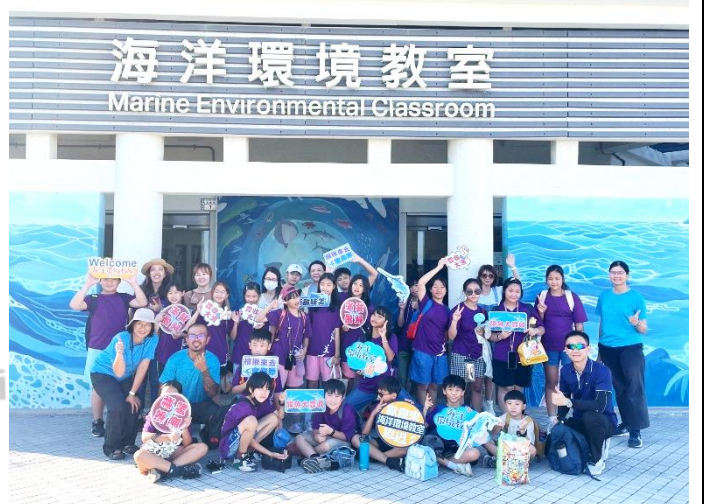
說明：活動圓滿落幕，師生家長與海洋環境教室老師們合影留念，開心與收穫滿滿的戶外學習課程。