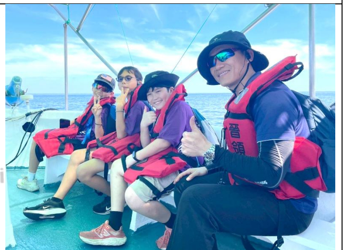
說明：搭賞鯨船出海觀察鯨豚生態