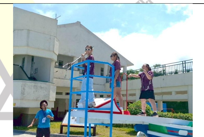
說明：學生模擬鏢旗魚的感覺