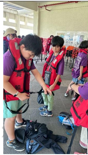
說明：穿救生衣體驗