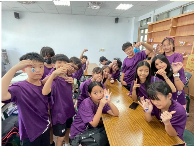
說明：看我們的熱縮片成品