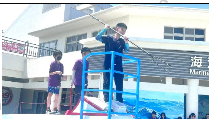
說明：體驗站在船頭鏢旗魚