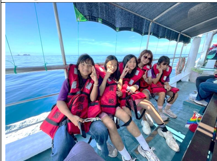
說明：風平浪靜出海囉！期待遇見可愛的鯨豚們